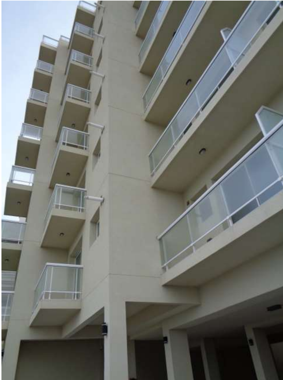
Edificio BRISAMAR I – EDIFICIO INTELIGENTE

En nuestros ultimos Informes esbozamos nuestra estrategia central... Leer más